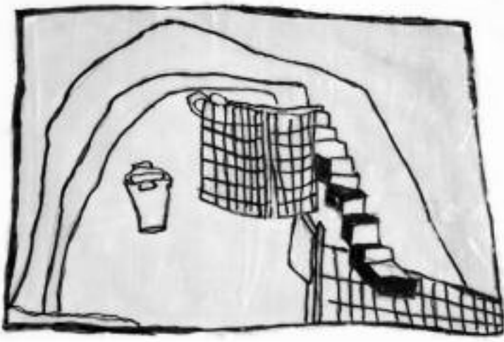
acryl, marker, binder, papier auf karton 21x30cm, www.atelieroffen.ch